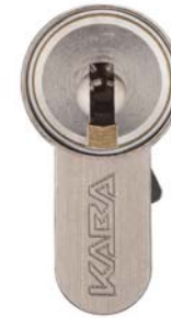
Posición de retirada de 6 horas