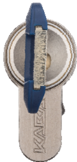
Llave de propietario Llave de servicio